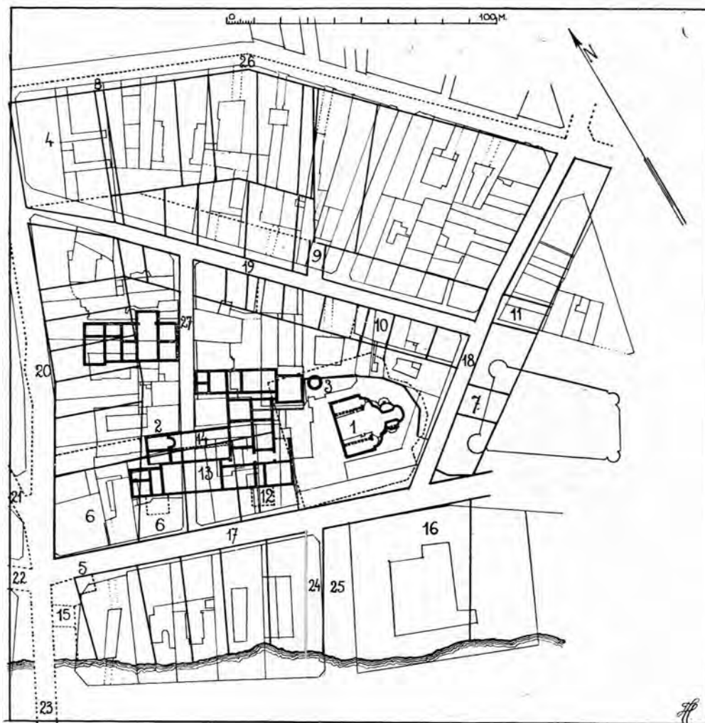
Fig. 1. — Curtea Veche din București, după planul din 1799: 1. Biserica Domnească, cu trei altare; 2. Paraclisul din Palatul Domnesc; 3. Baia cu cuptor subteran, găsită în săpături dar nefigurând în plan; 4. Parcela pe care se afla baia din Curtea Veche; 5. Poarta din sus, cu foișor; 6. Parcelele cumpărate de Vornicul Golescu, pe care a făcut Hanu Roșu: clădirea, în forma de U se găsește în planul Borroczyz din 1852; 7. Altă parcelă cumpărată de același; 8. Zidul despre dosul Șelarilor; 9. Loc de 3 stânjeni lăsat pentru uliță nouă în colțul despre zidul pușcării; 10. Parcela cumpărată de Ilie, vătaful de pușcărie; 11. Polcul de Vânători; 12. Pridvor de intrare în Palat, ce nu figurează decât în planul din 1791; 13. Sala mare; 14. Sala mare susținută la mijloc de un rând de coloane; 15. Cafineonul lui Altântop în 1801; 16. Parcela pe care s'a construit o parte din Hanul Manuc; 17. Podul prin Curtea Veche, larg de 8 m, Podul dela Curtea Veche în 1804, Ulița Curtea Veche în 1852, actuala strada Carol; 18. Podul nou, larg de 6 m; Ulița Șepcari în 1852; 19. Podul nou, larg de 5,50 m; Ulița Covaci în 1852, actuala strada Oituz; 20. Podul spre Mihel Beceriu, larg de 8,50 m; Pod ce merge spre Șelari în 1804; Ulița Șelari în 1852; Ulița lui Ccstandinache în 1825; 21. Fără nume în planul din 1799; larg de 6 m, Podul ce merge dela Curtea Veche spre Hanul lui Șerban-Vodă în 1804; Ulița Nemțească în 1852; strada Germană în 1876, actuala strada Smârdan; 22. Fără nume în planul din 1799, larg de 8 m; Boiangii și Ișlicari în 1804; Ulița Franțuzească în 1852, actuala strada Carol; 23. Podul spre Dcamna Bălașa, larg de 8 m; 24. Drumul Sacagiilor, larg de 6 m; Vadul Sacagiilor în 1804; fără nume în planul din 1852, dar cu pod de trecere peste apă; actuala strada Căldărari (25); 26. Ulița în dcusul Șălarilor, largă de 6 m; Fără nume în planul din 1852, actuala strada Gabroveni; 27. Ulița la binale, largă de 5,50 m, prelungită, fără nume, până în strada Carol, înainte de 1852, actuala strada Soarelui.

în jurul unei curți centrale, figurată în planul din 1791. Biserica Domnească (fig. 1—1), care nu trebuie confundată cu paraclisul palatului, ni se arată într-o formă inte-