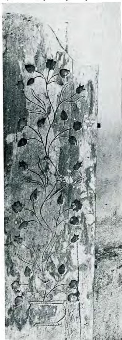
Fig. 2. — Vechea ușă împărătească cu încrustații în lemn la biserica Sfântul Ilie din Câmpulung.

Nu este singurul exemplu de lucrare în lemn încrustat din vechea noastră artă bisericească și deși le întâlnim destul de rar, credem că au avut totuși epoca lor de înflorire. Dacă ni s'au păstrat așa de puține exemplare presupunem că e numai