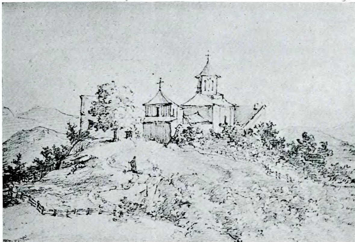
Fig. 3. — «Flămânda veștută dupe Riū partea miadă-și Câmpu lung Muș.» fragment, după un desen în creion din Albumul Național al pictorului Gh. Tattarescu (1860).