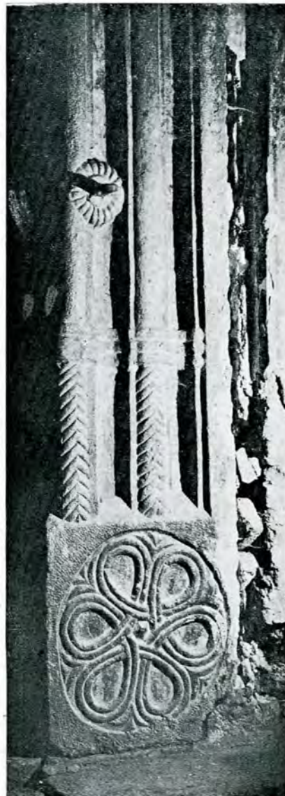
Fig.3.— Biserica din Golești. Ușa dintre pronaos și naos. Detaliu.

utilul cu frumosul. Nu știm dacă acest ingenios exemplu a fost imitat (fig. 2 și 3).