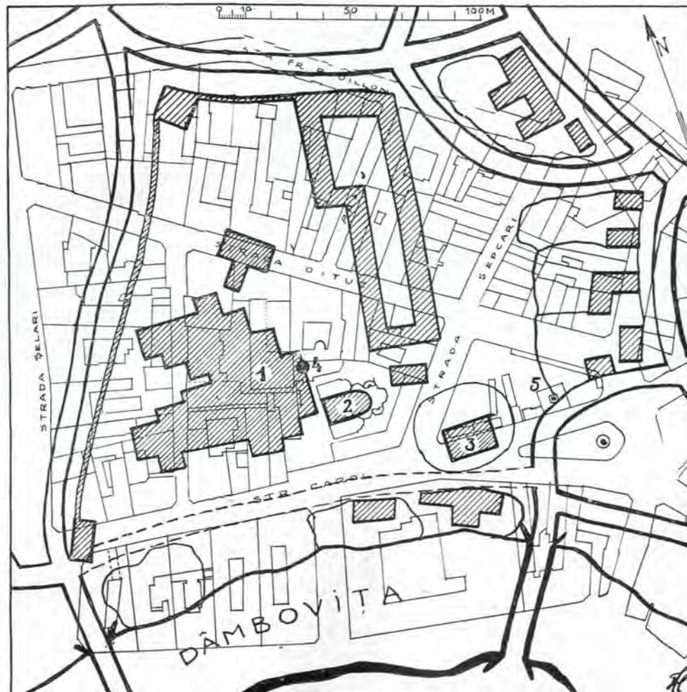
Fig. 4. — Curtea Veche din București, după planul lui Ferdinand Ernst. 1. Palatul domnesc. 2. Biserica Domnească. 3. Biserica Sf. Anton. 4. Baia. 5. Monumentul din piața de flori.

ară că în acest interval de aproape 13 ani se ștersese orice urmă a Bisericii. În planul Borroczyn, din anul 1852, adică numai cinci ani după incendiu, biserica nu mai figurează 1) ; piața Sfântul Anton este reprezentată liberă de orice construcții, iar o fotografie a pieții anterioară anului 1830 — deoarece monumentul nu figurează la locul său — ne arată de asemeni că piața