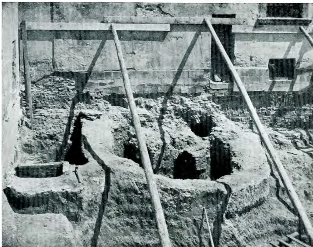
Fig. 1. — Curtea Veche din București. Ruinele cuptorului subteran al băii.

În două laturi neconsecutive ale octogonului și anume în laturile din spre nord-est și nord-vest, se găseau, boltite în jumă-